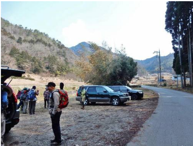
分岐道手前の駐車場所

沢沿いを下って行くと林道に出て分岐に合流して駐車場に戻り着き、リーダーがぜんざいを振る舞ってくれた。