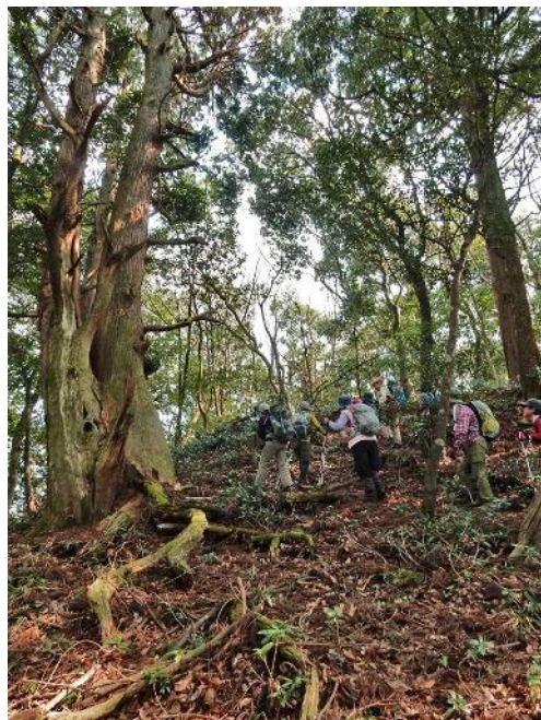
千年杉を見ながら登る