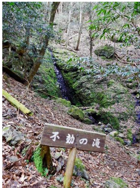
不動の滝 水量がない