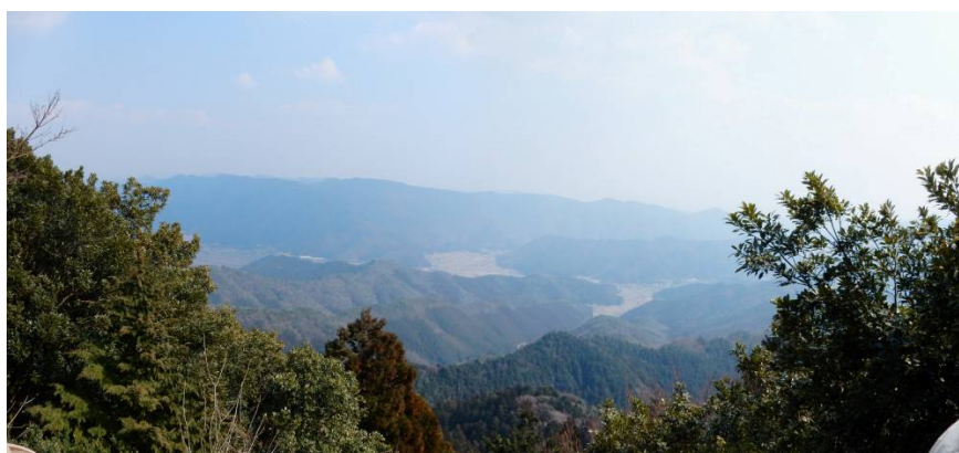
仙ノ岩の先から南方向パノラマ