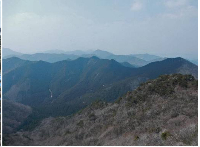
白髪岳登山道より西方面