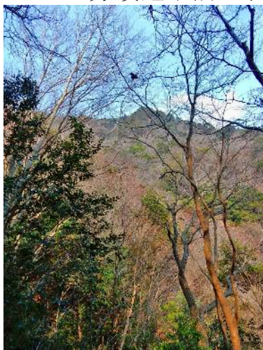
樹林間より 松尾山を望む