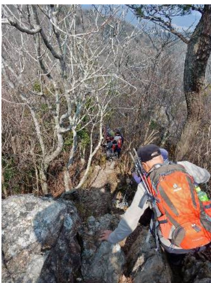
白髪岳からの下り