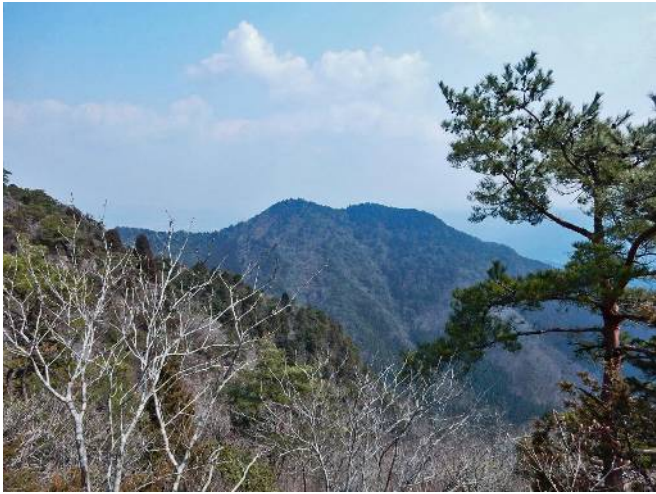
白髪岳登山道より松尾山