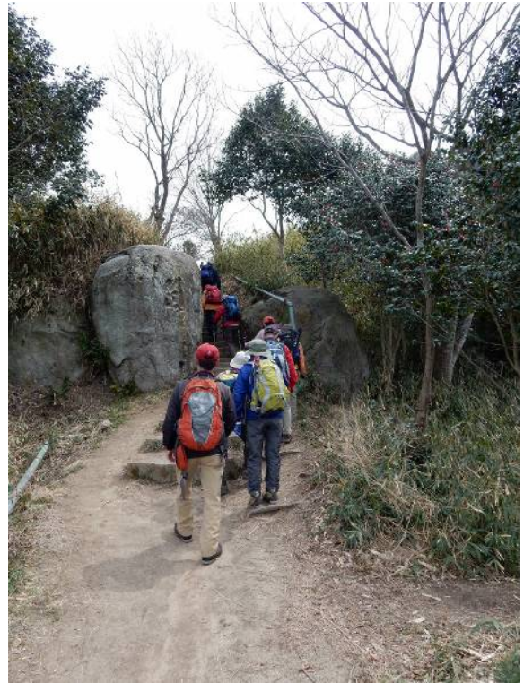
岩の間をすり抜ける