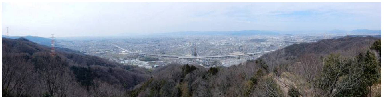
交野山より大阪平野