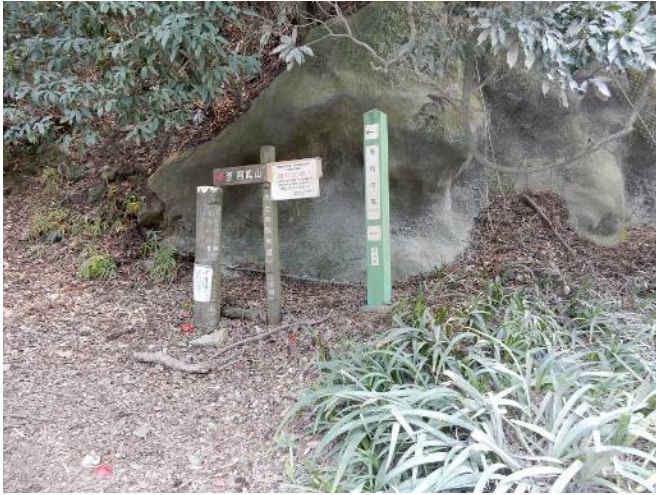
武士自然歩道入口