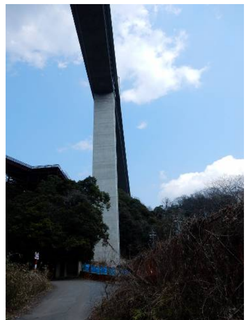
新名神を見上げる