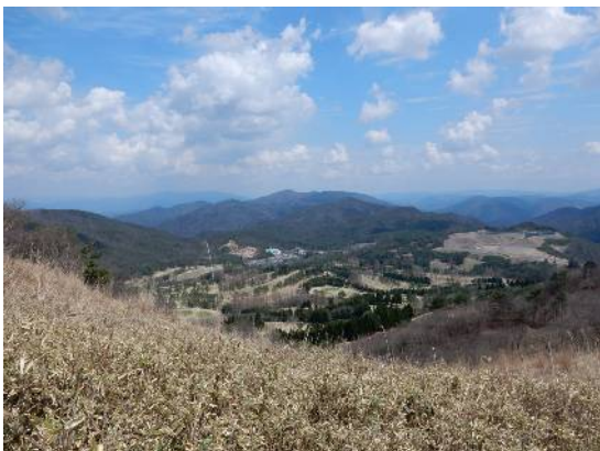
登山道より半国山方面