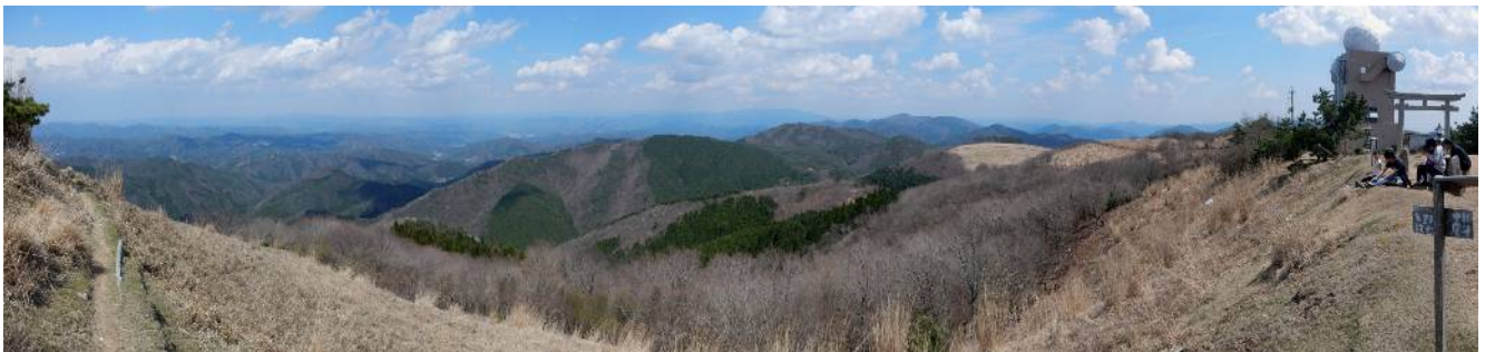
深山山頂より東南方面