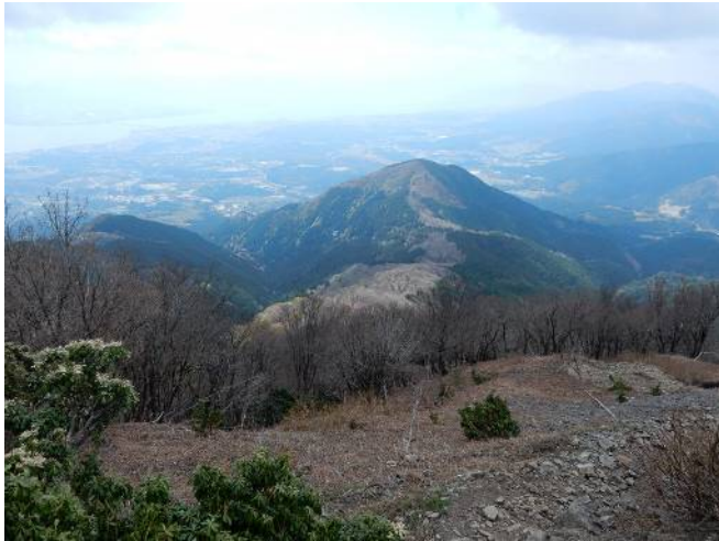
権現山より霊仙山