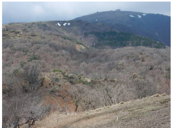
ホッケ山より蓬萊山