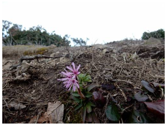
シヨウジヨウバカマ