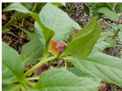
ハシリドコロ (猛毒植物)