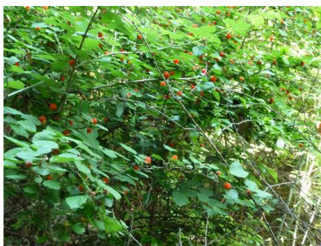
野イチゴの様な実が