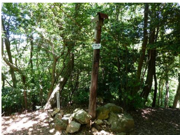
十方山の山頂は展望なし