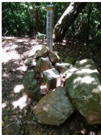
十方山の三角点 点名は天王