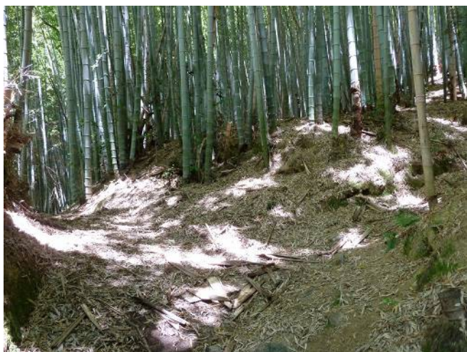
最初の分岐を右へ