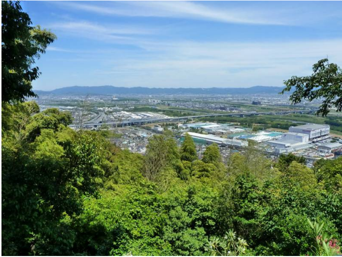
旗立松展望台より 京滋バイパス、京都南部