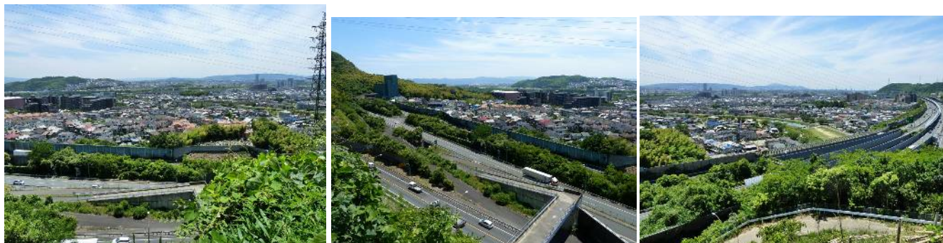
登り口からの風景