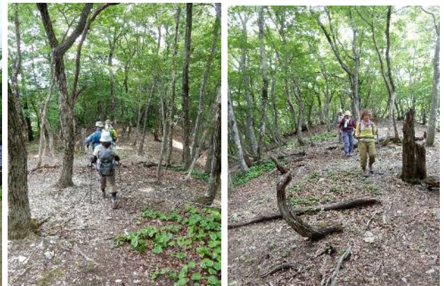
長老ヶ岳からの下り