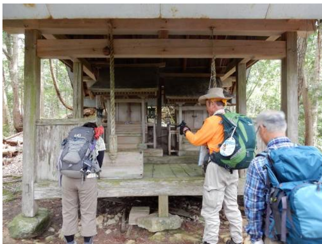
愛 宕 神 社 へ