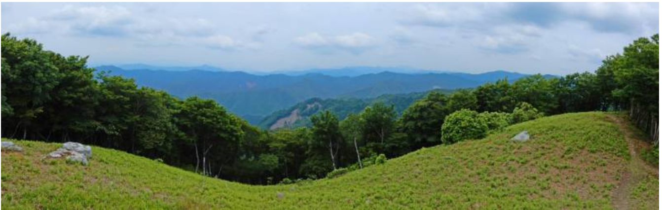
長老ヶ岳からのパノラマ（北西311度から北4.7度）