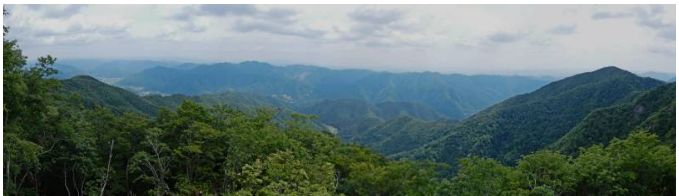
大岩からのパノラマ（東南107度から西南243度）