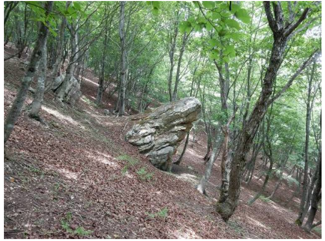
カ エ ル 岩