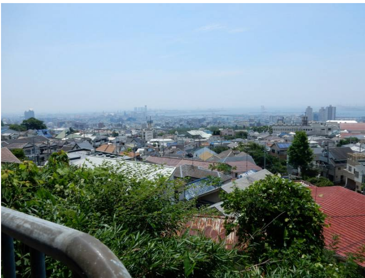
青谷道登山口より神戸市街

摩耶山展望所の掬星台に向かが道路の周りに咲いているアジサイはなくなりがかりしながら掬星台に到着するが霞が展望を妨げていて感激が湧いて来なく歩く気力も無くし、ロープウェイで下る事にした。