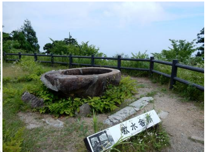
旧 天 上 寺 敷 地