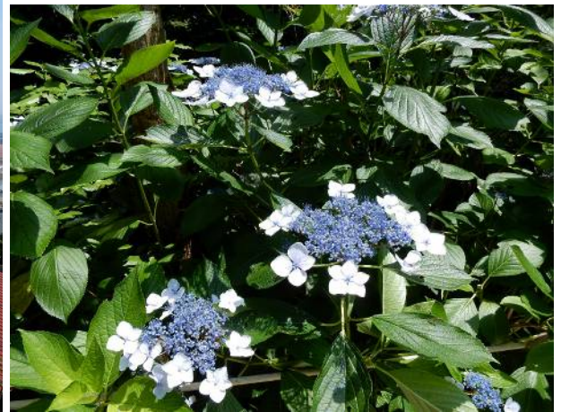
最初に出会った紫陽花