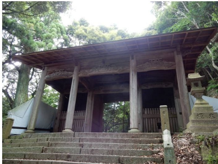
焼け残っている旧天上寺の山門