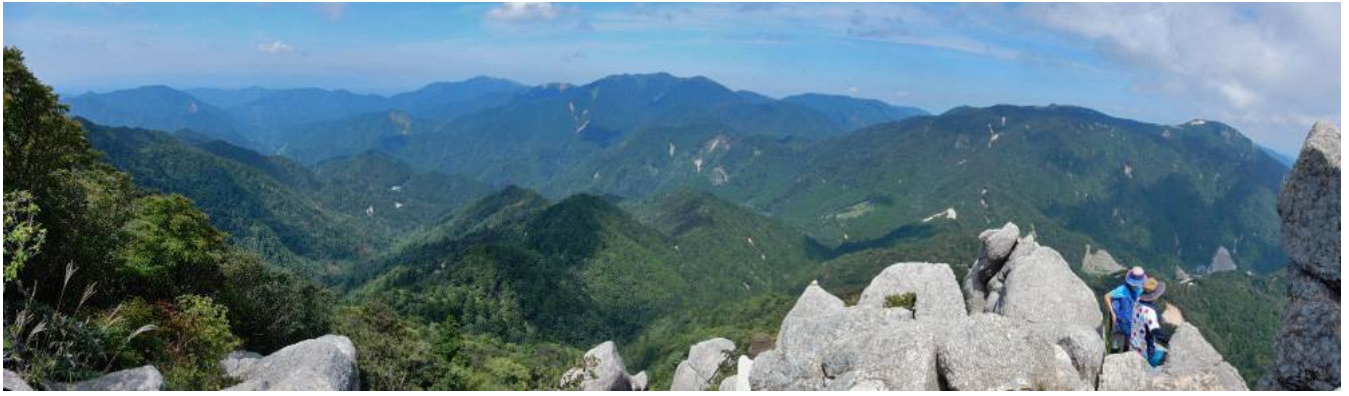
鎌ヶ岳からのパノラマ