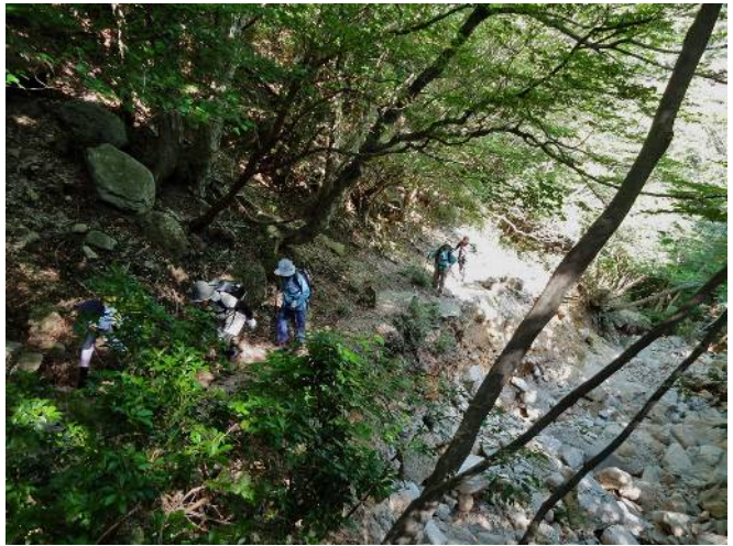
三ッ口谷からスカイライン脇道を駐車場へ