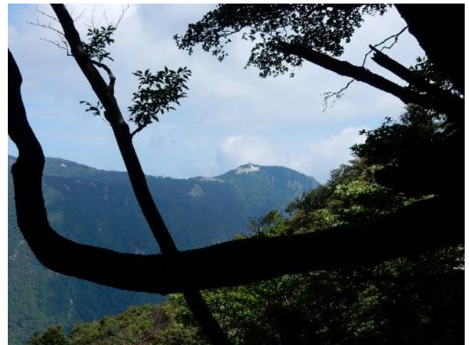
レーダーサイトがある