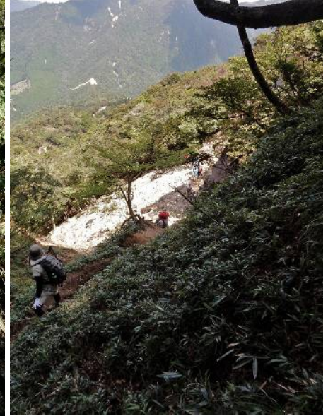
急な斜面を登って行く