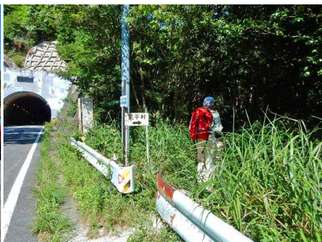
武平峠へ（トンネルの上にある）