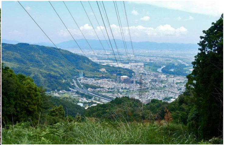
下山口より天王山方向