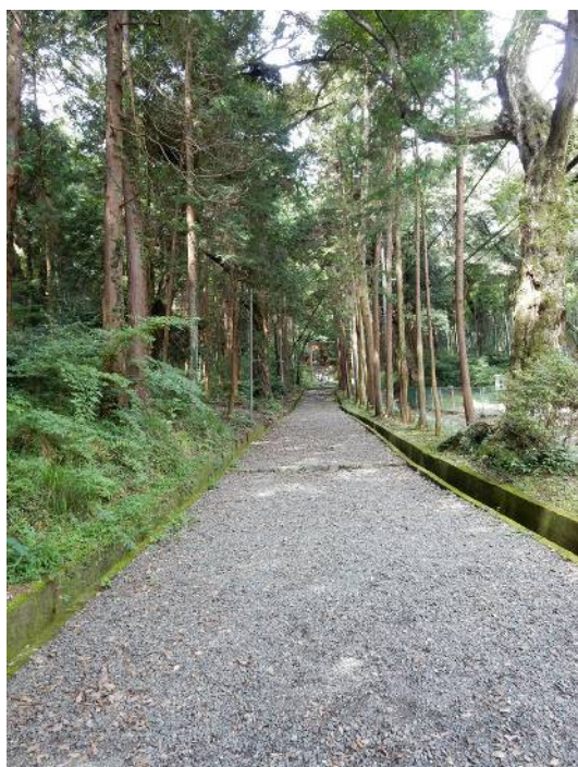
若山神社への参道

先行者の一行が立ち去った後、食事休憩をして向かいの尾根から帰る事を決めて歩き出し12時38分桜井台住宅地に下山する。