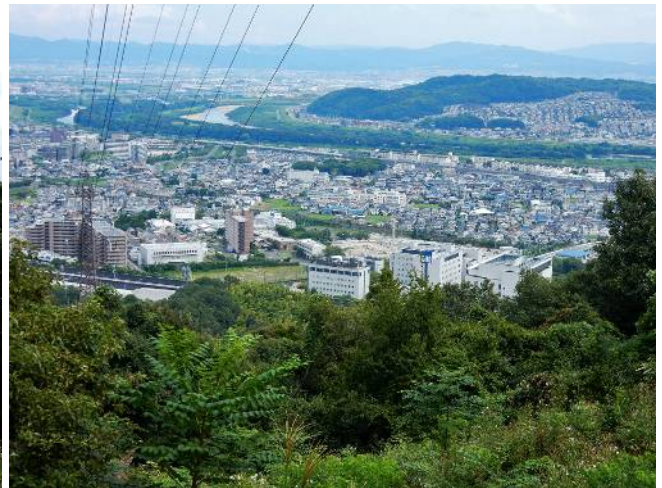
下山道より島本を見下ろす