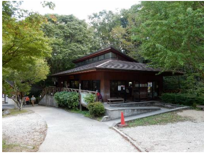
ピントの小屋 クライミングウォール