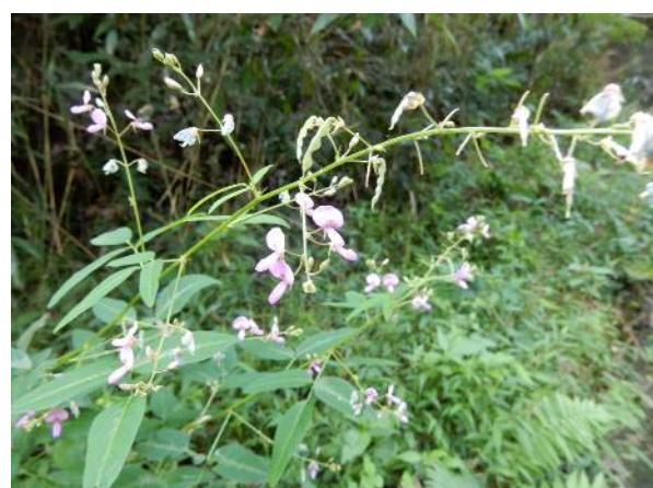
管 理 道 に 咲 く 花