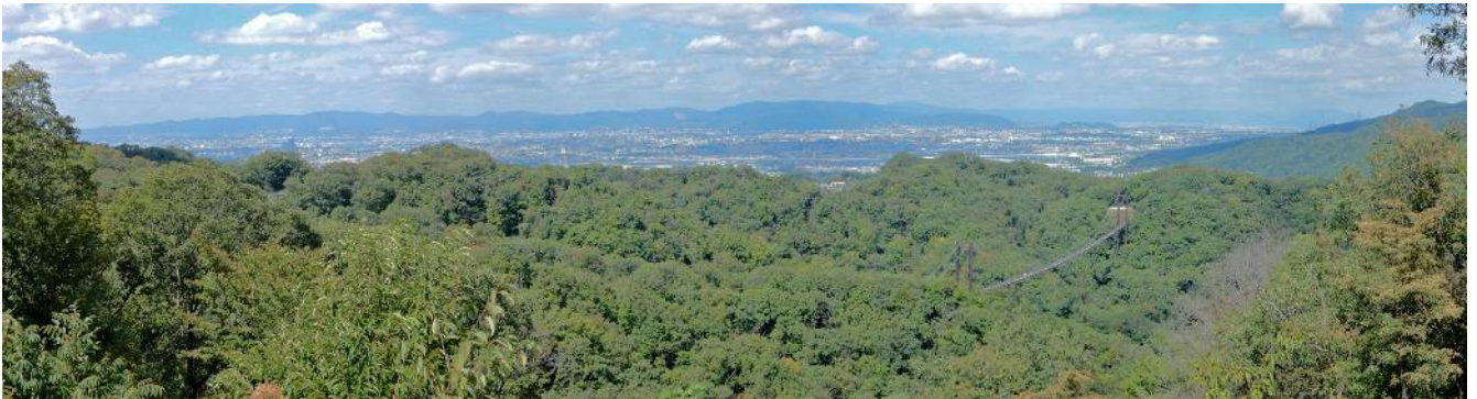
展望デッキよりパノラマ