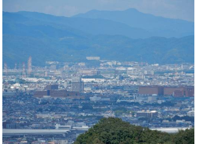
島本方面（奥は愛宕山）