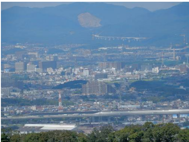
名神高速道路を望む