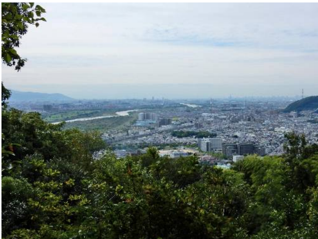
青木葉谷展望所より島本方面

ここまで来て腰痛で腰が重く歩きにも支障が出始め、尺代に出て集落を抜けて若山神社には立ち寄らず自宅を目指しよろよろになりながら帰り着く。