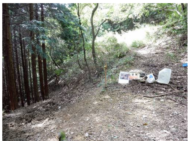
ギロバチ峠 (左の奥が水無瀬溪谷)