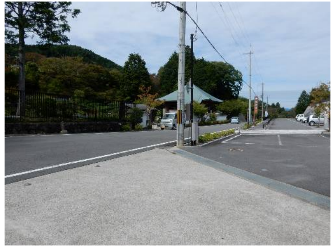
柳谷観音前交差点