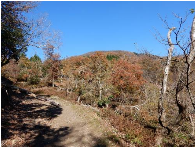
登山道より権現山