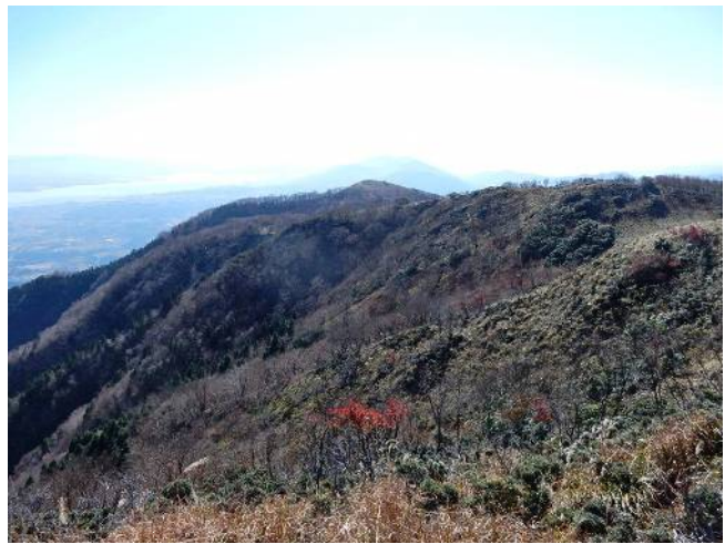
ホッケ山 奥は比叡山