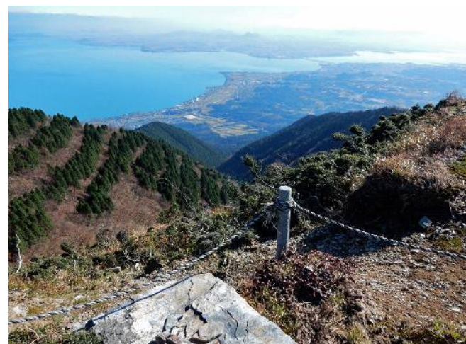
小女郎峠より琵琶湖を見下ろす