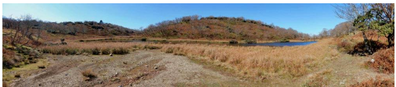
小女郎池のパノラマ