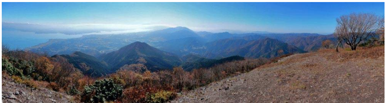
権現山からのパノラマ