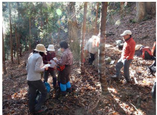
現在地を確認する