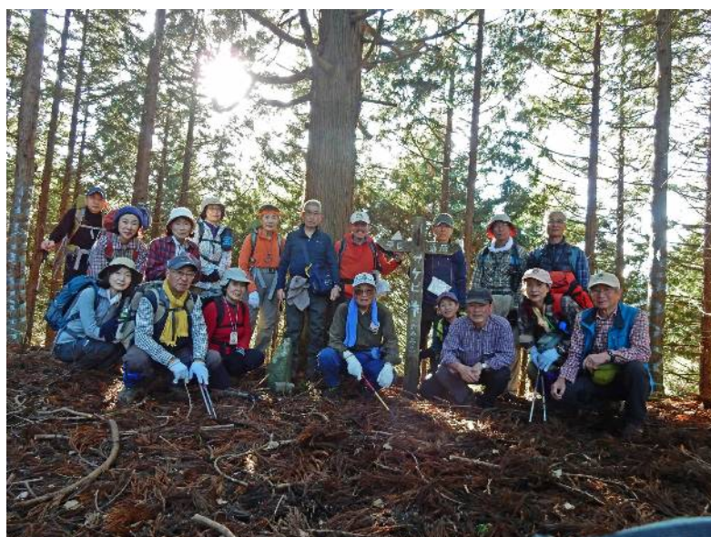
峠 に て