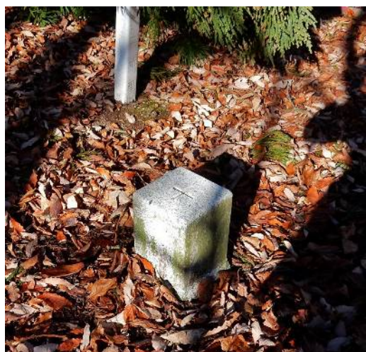
正座峰（生姜谷峰）山頂