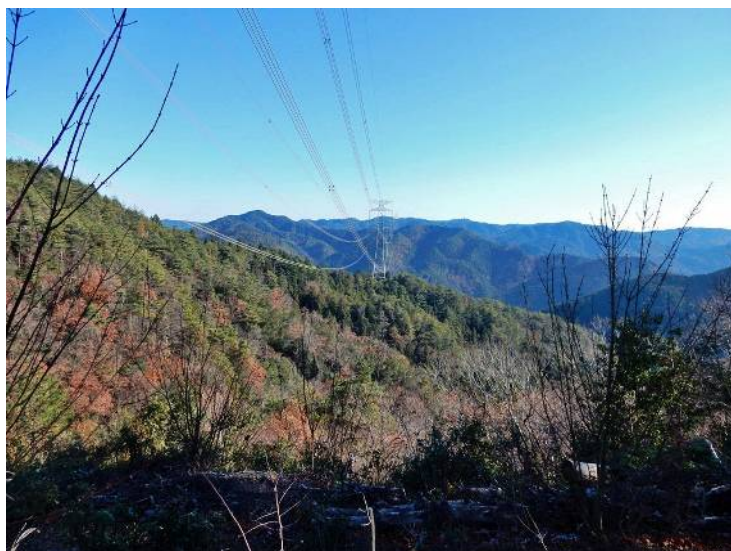
P416より猪瀬山を望む

私はさっさと下ったが、植物好きな方々は観察しながら下って行き、戻った登山口で時間を持て余した。