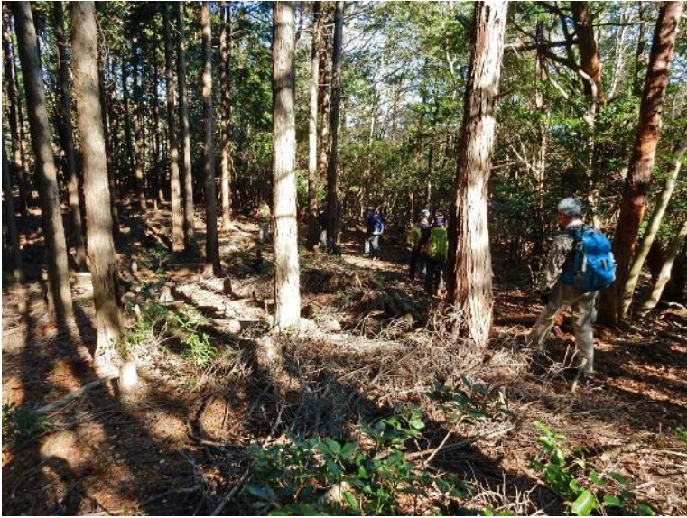
県境を歩いて行く