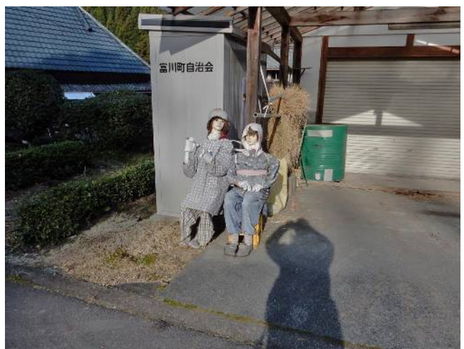
下山口で案山子が出迎え