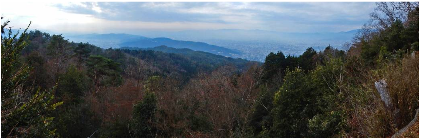
大文字山頂より京都市街パノラマ