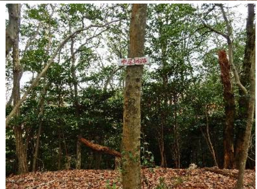
銀閣寺下山道の中尾城跡標識