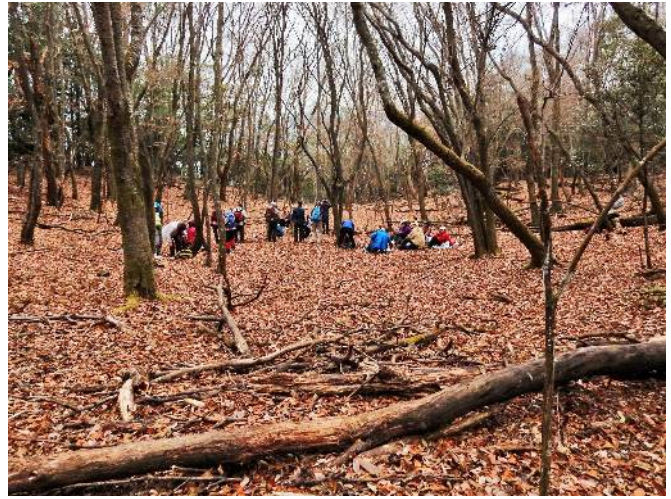
四ツ辻奥の広場に居る先行者