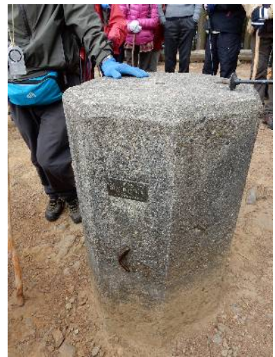
山頂の菱形基線測点