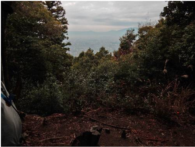
灌木を伐採した隙間より 京都市街（平安神宮の鳥居が見えるが）