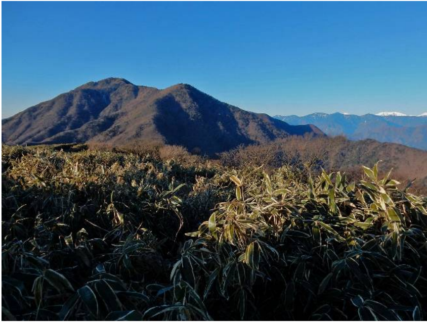
竜ヶ岳から 手前が雨ヶ岳 奥がタカドッキョ