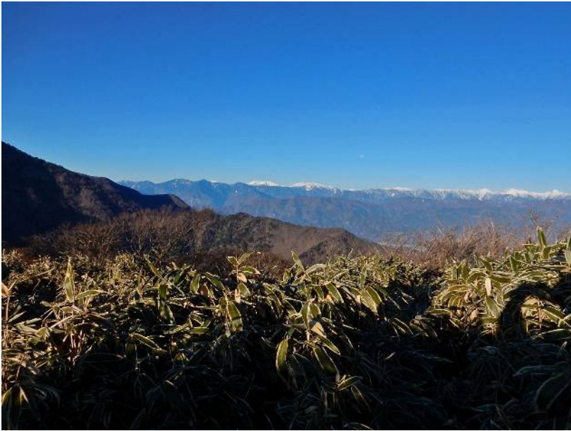
上・下とも 竜ヶ岳からの 南アルプスを望む