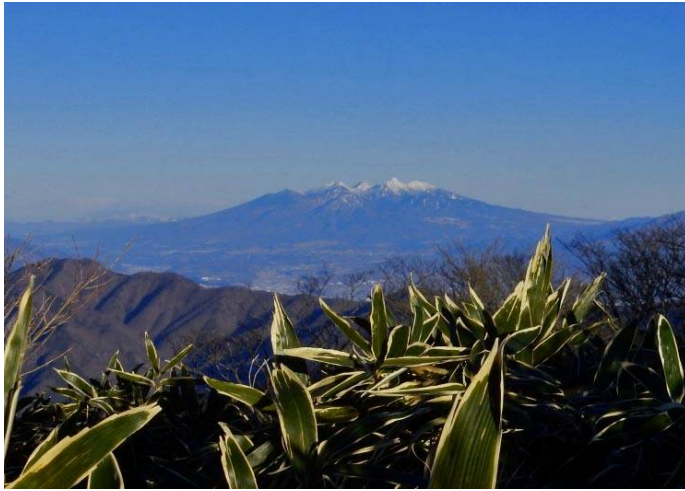
竜ヶ岳からの 八ヶ岳を望む