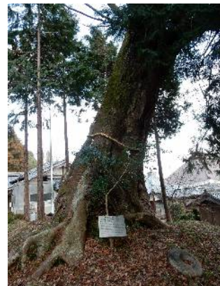
帰路時：ケヤキの古木