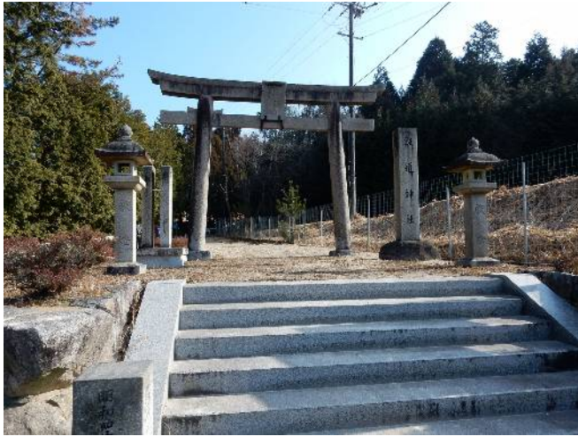
飯道神社石の鳥居