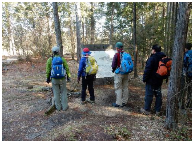
紫 香 樂 宮 跡 を 観 て 歩 く