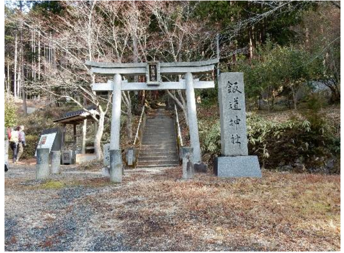
此処が飯道神社及び飯道山登り口