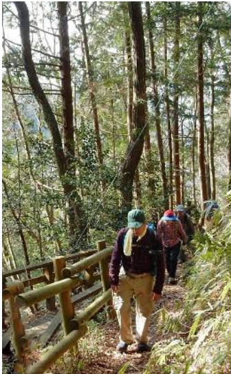
参道を登って行く