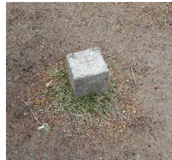
飯道山山頂の標識と三角点