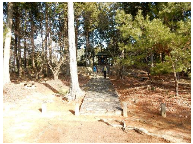
紫 香 樂 宮 跡 を 観 て 歩 く