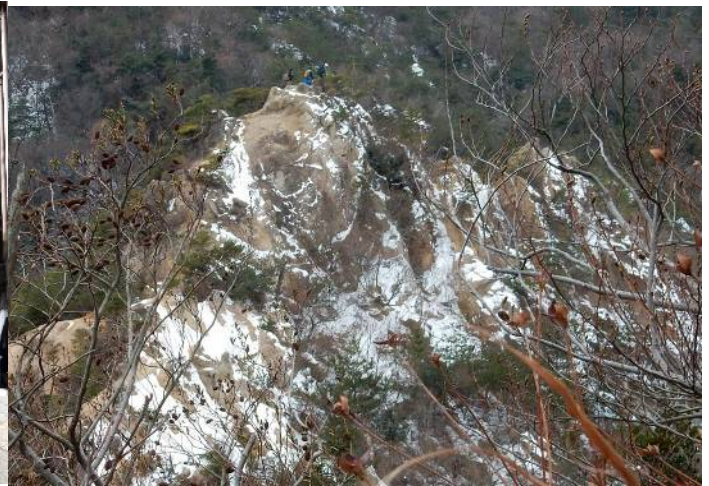
ロックガーデン上級者コース