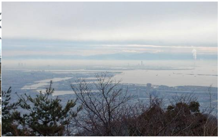
風吹き岩より大阪湾