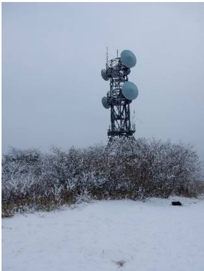
最高峰のレーザーサイト