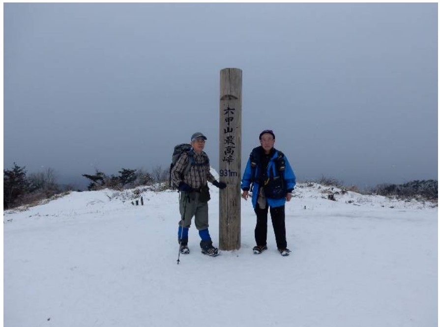
六甲山最高峰にて