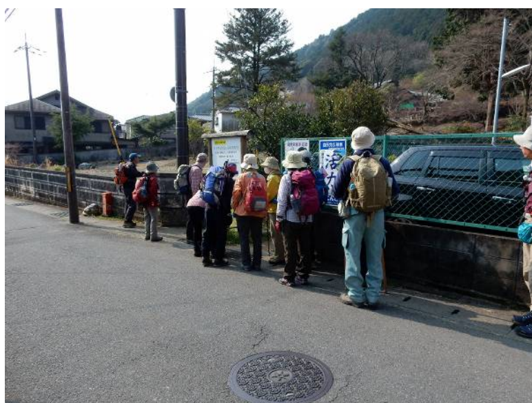
トレイルの登り口