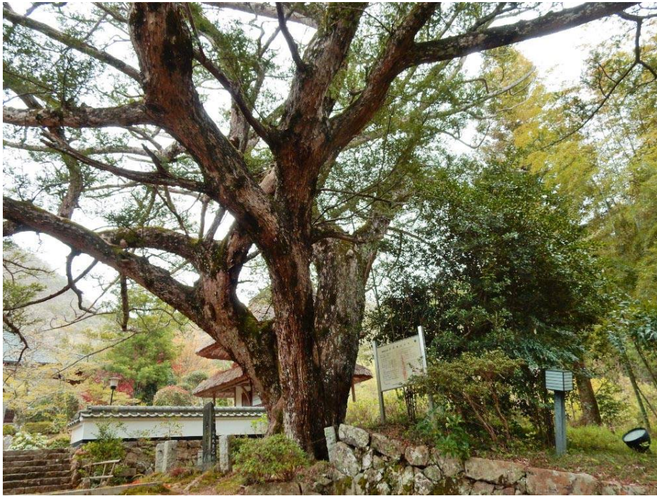
大船寺のカヤの木