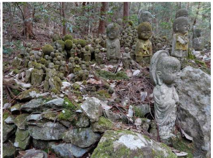
ミニ観音霊場の石像