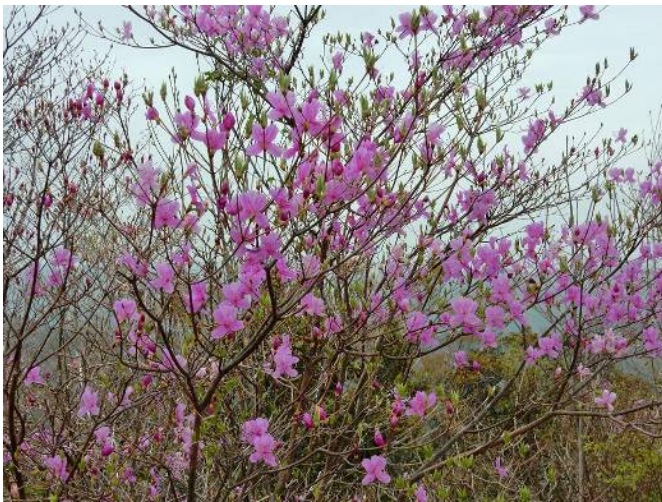
山頂の三つ葉ツツジ