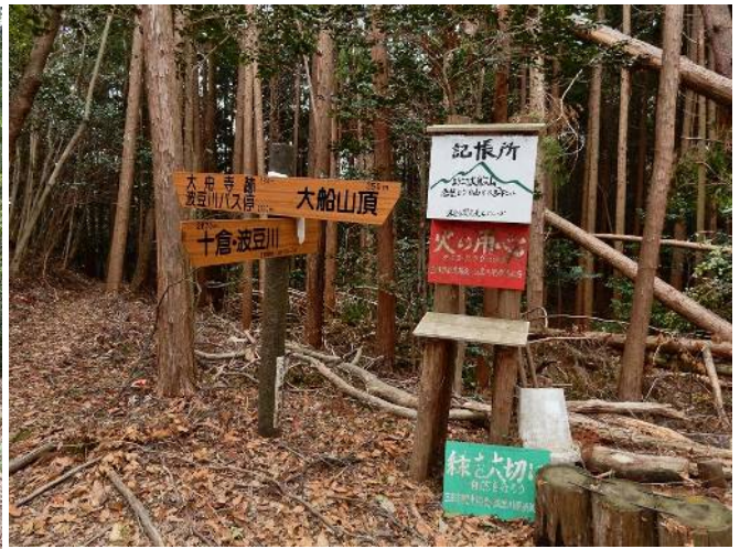
コルにある案内標識