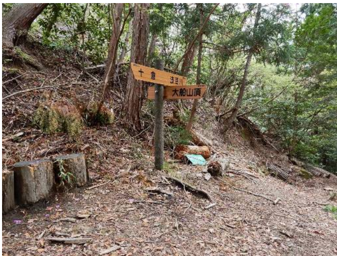
峠にある案内標識