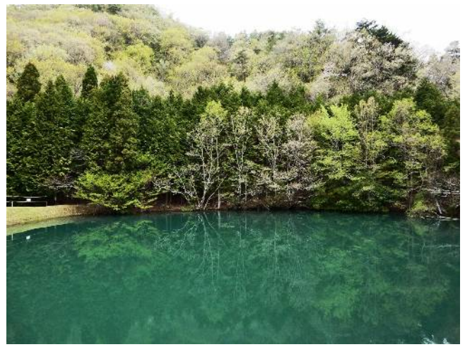
三つ目の溜池（鏡池になっている）