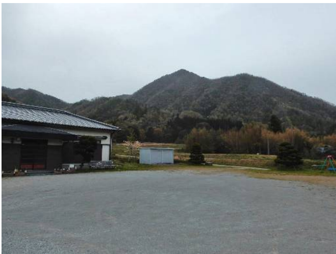
十倉公会堂より大船山を望む

グループと別れ十倉へ下って行く、雑木林を抜けると溜池に出て朝と同じように鏡池に出合ってから小休止してから13時43分雨に合わずに十倉に帰り着く。