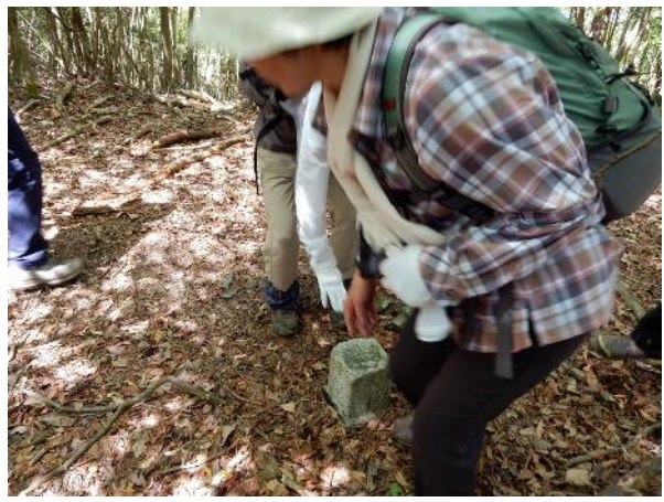
大 焼 山 の 山 頂 と 三 角 点