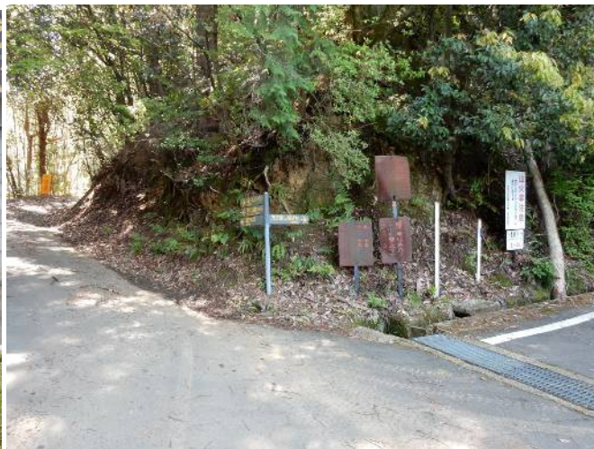
此処を右に万灯呂山に向かう