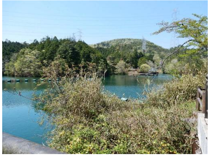
大 正 池