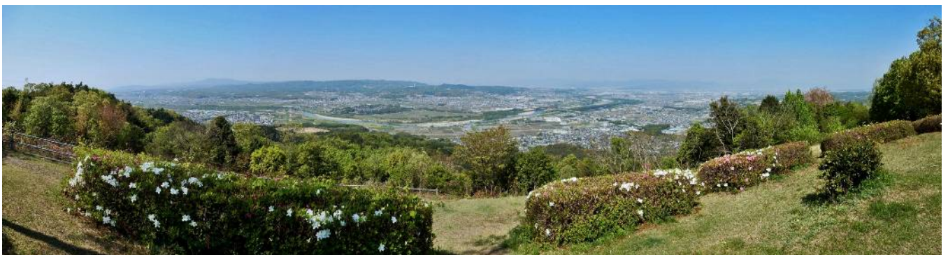
万灯呂山展望台からのパノラマ