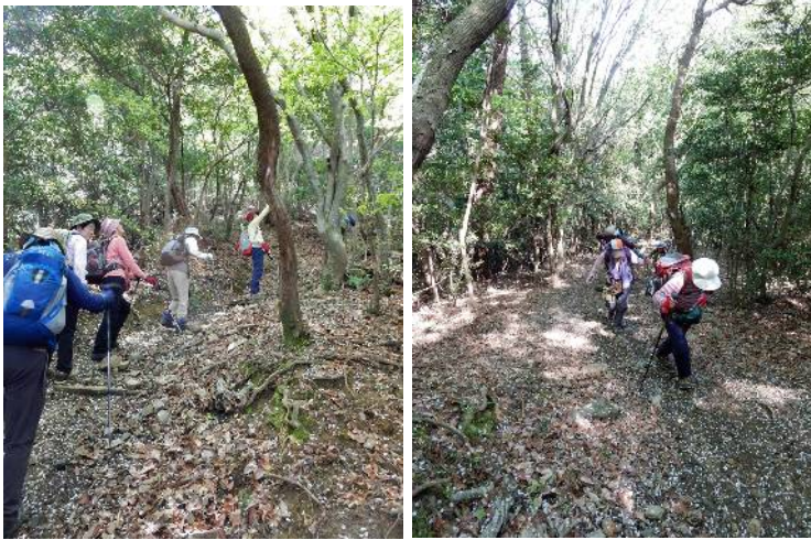
万灯呂山への登り