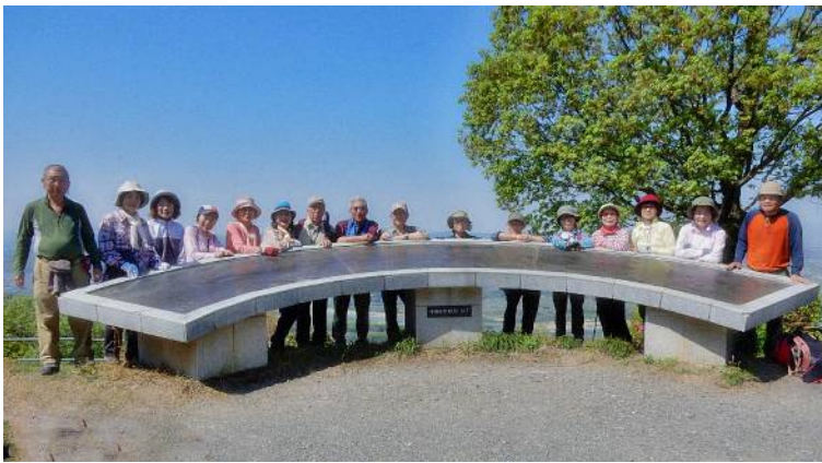
万灯呂山展望台にて