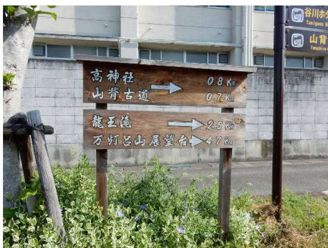
山城多賀駅前の表示板

玉水駅の方が若干近いようだが下山道が悪いようで、安全に下れる棚倉駅へ予定通り下る事に決まり下って行き16時19分駅に到着、帰途の電車が来るまで5分程しか余裕なく早々ホームに向かい帰途に着く。