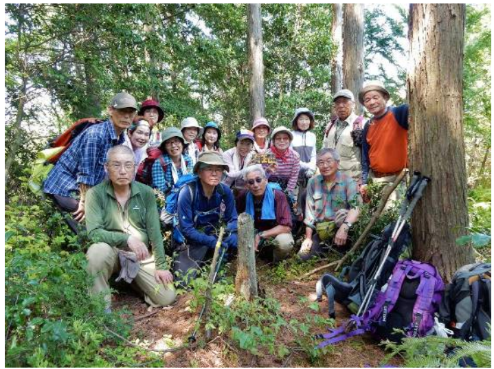
有 王 山 の 山 頂 に て