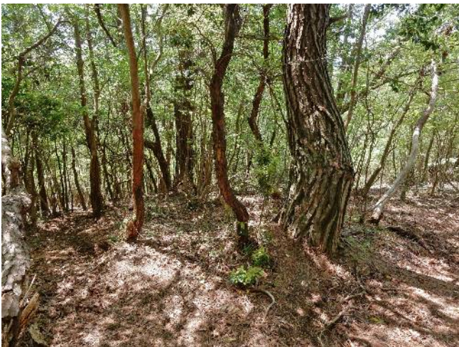
左に入り県境尾根を行く