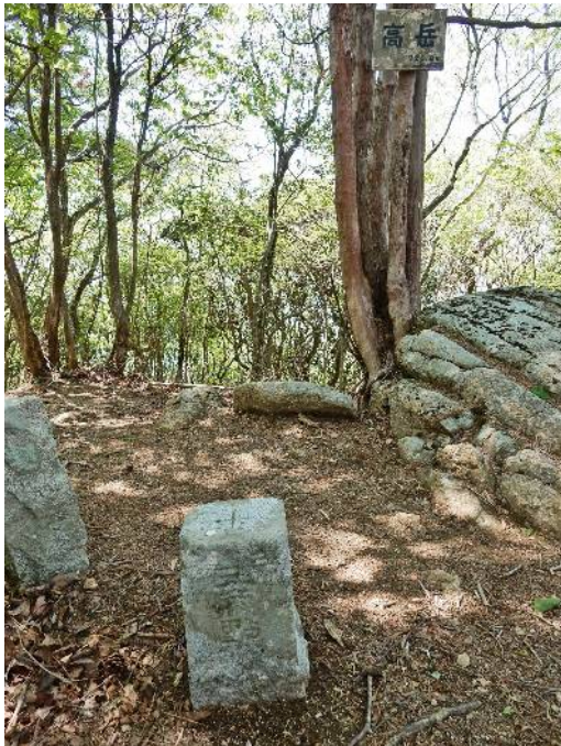
高岳山頂の三角点