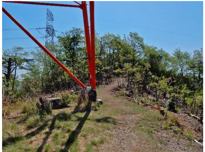
鉄塔から高岳を見上げる