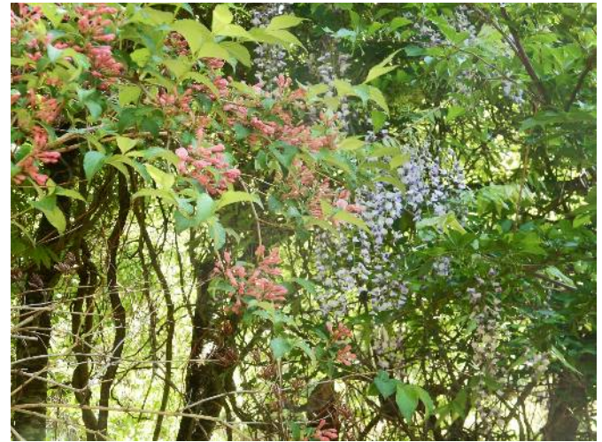
タニウツギ と フジ