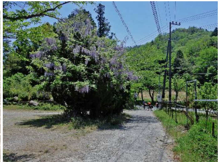
フジと中山峠にサイクルの人達