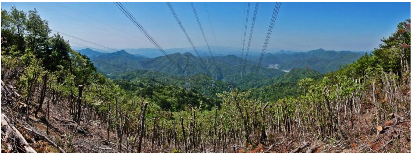
高岳からのパノラマ