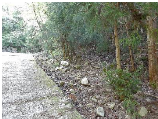
ここを右に入る（登山口）