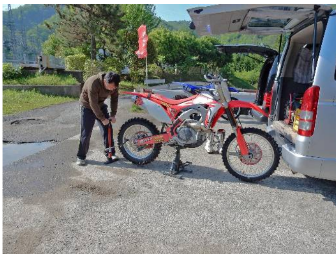
モトクロスバイク

途中で張り出した尾根に行かないよう地図を確認しながら下って行き最後まで道は続いていて中山峠に出られ車で来た道を歩き駐車場所まで戻る。