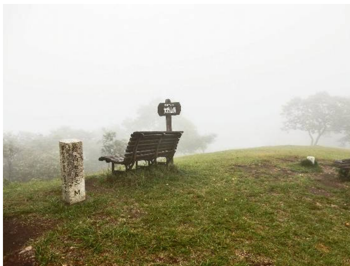
大野山の山頂 石柱と三角点