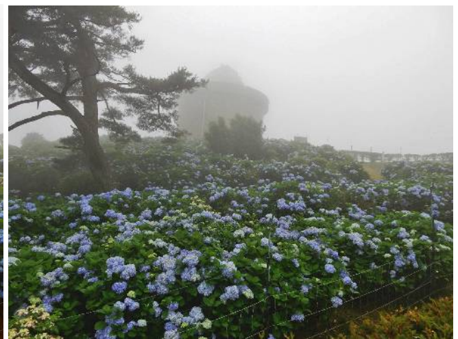
あじさいと霧に霞む天文台