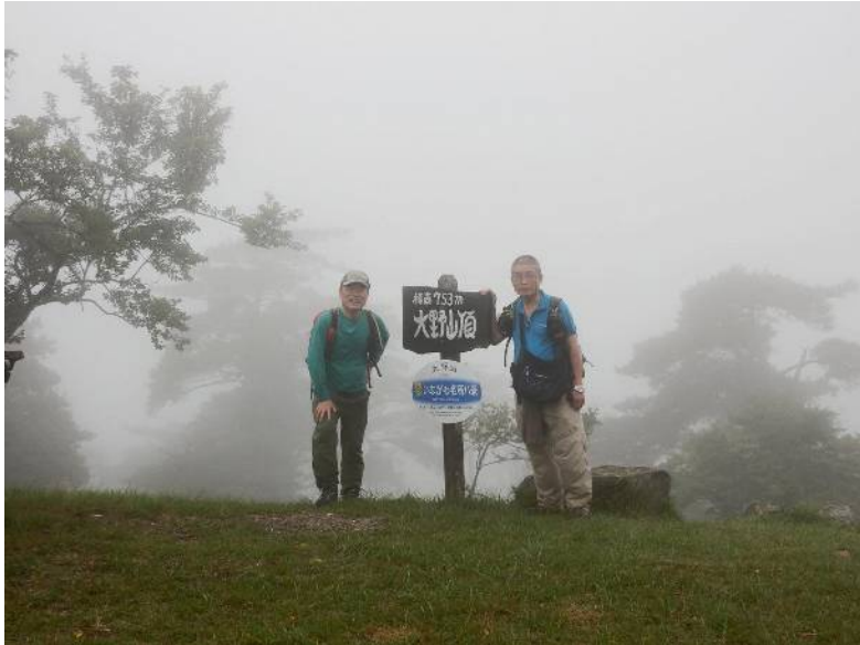
大 野 山 山 頂