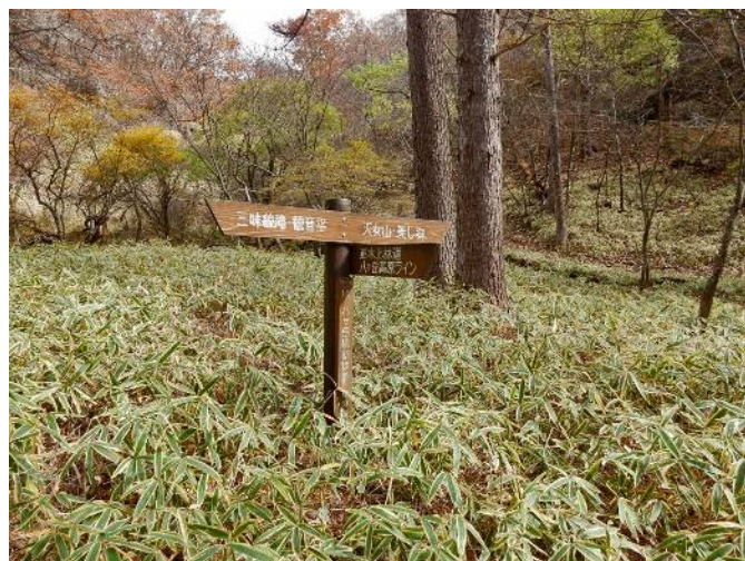
横断歩道内の黄葉