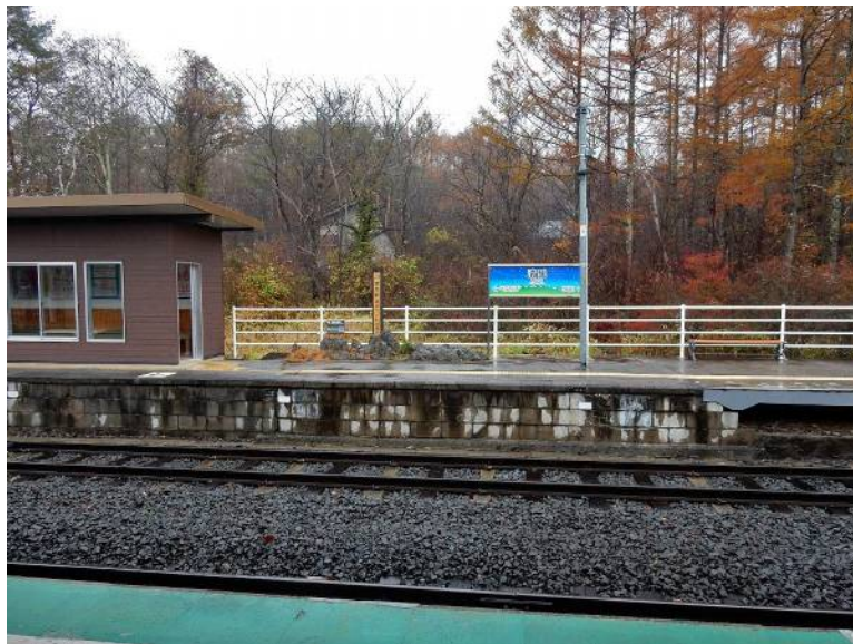
JR清里駅（小海線） 標高 1274mもある