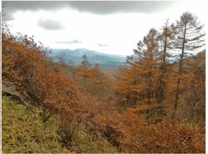
茅ヶ岳方向が望めた