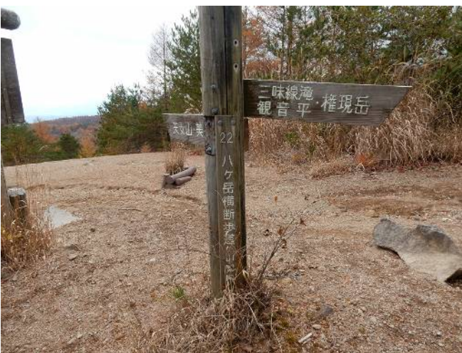
天ノ河原 富士山や南アルプスが見られる処だが