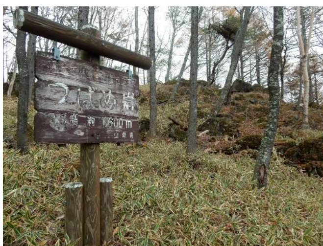
ツバメ岩 (何処にあるのか?)