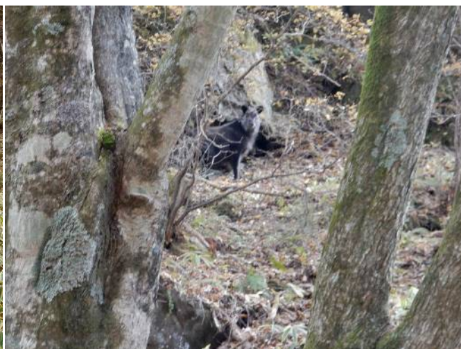
カモシカに遭遇する