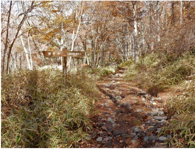
入り口よりすぐに右に折れる