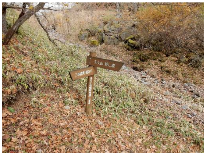
標識は最初と最後の方向のみ