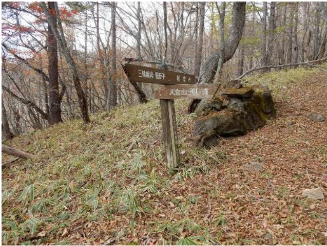
展望台分岐 (曇り空で行かず)