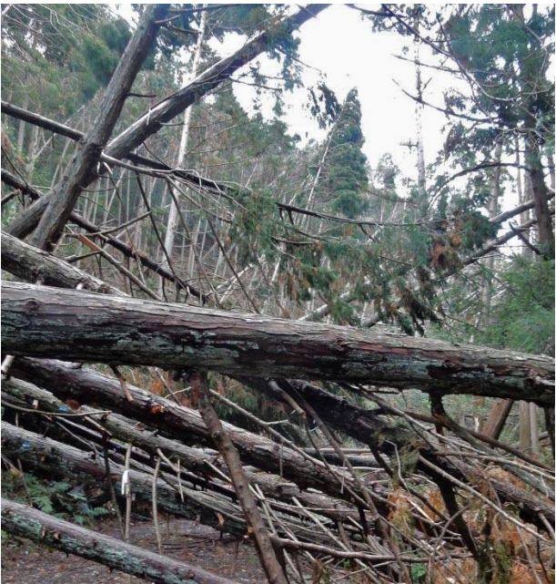
毘沙門天からの登山道倒木