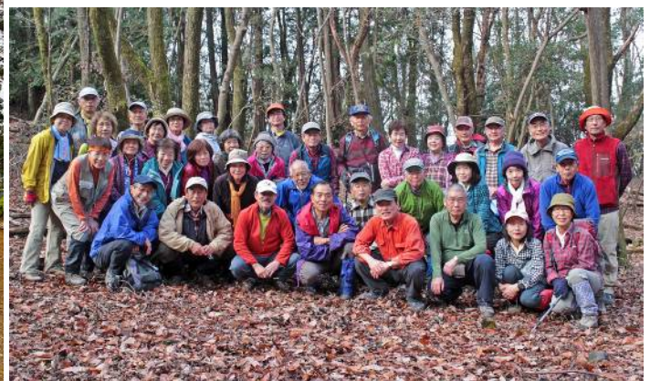
A B 合同で