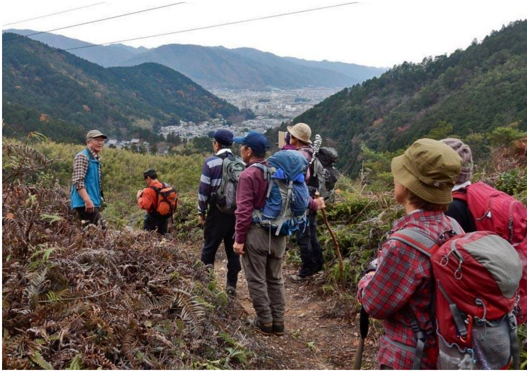
下山道より山科市街と毘沙門天を見下ろす