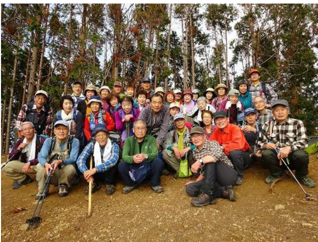
大文字山山頂にて