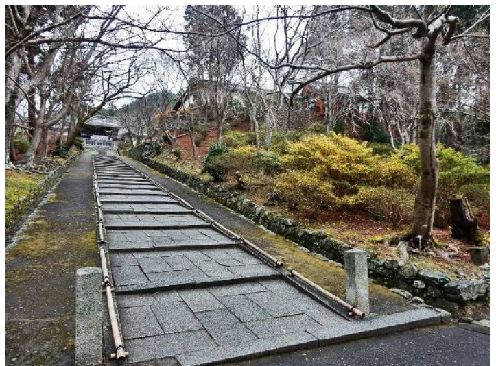
毘沙門天の毘沙門堂参道