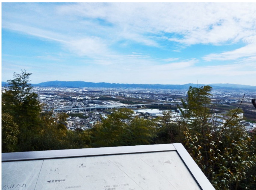
旗立松 展望台より 京都方面