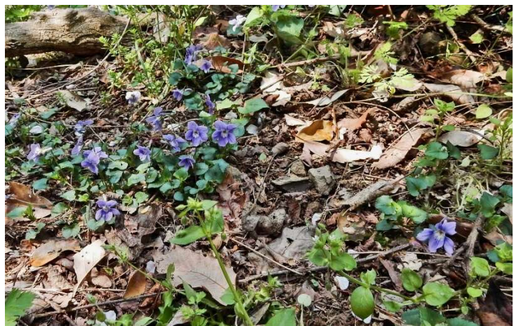
タ チ ツ ボ ス ミ レ