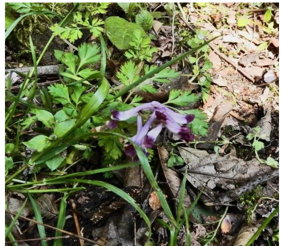
ゴルフ場前の稜線