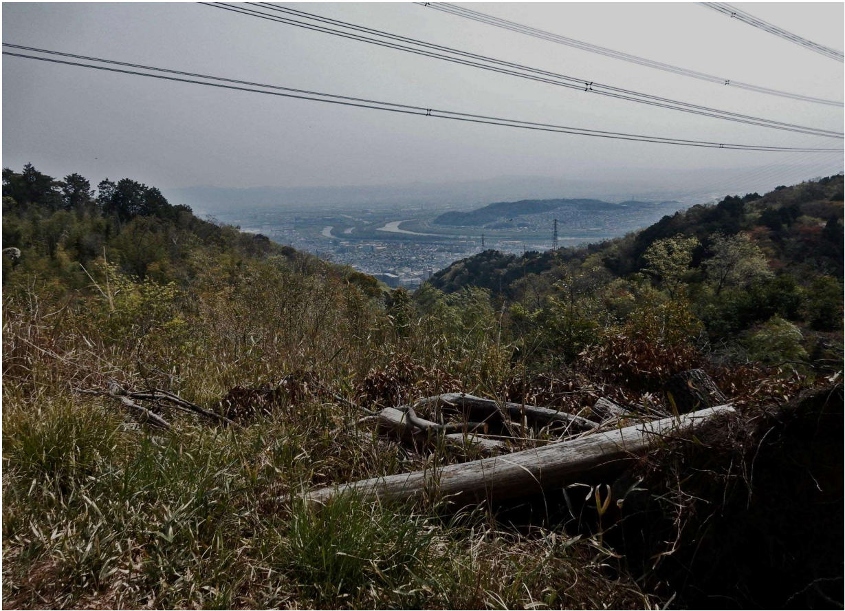
島本展望所からの三川合流点