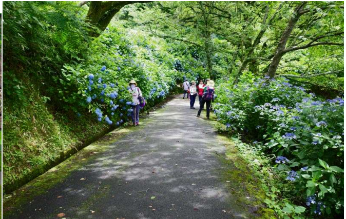
あじさい園の道（両側にあじさい）