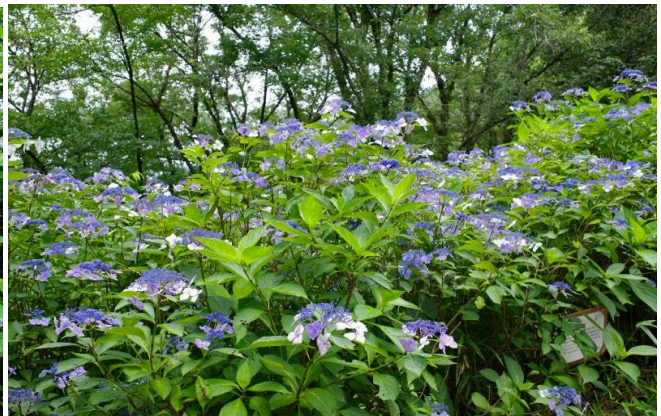
あじさい園の道（両側にあじさい）