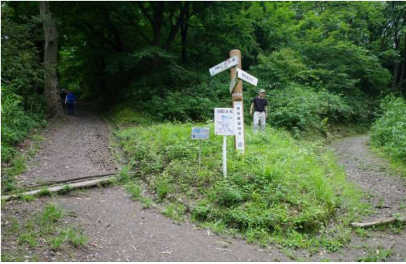
中展望から左の道が あじさい園への道