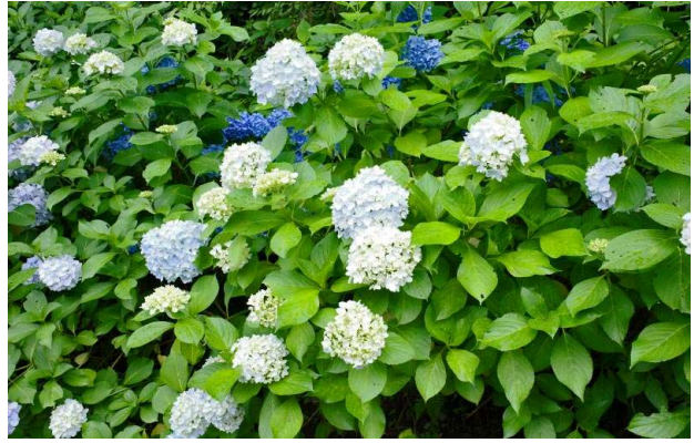
あじさい園の道（両側にあじさい）