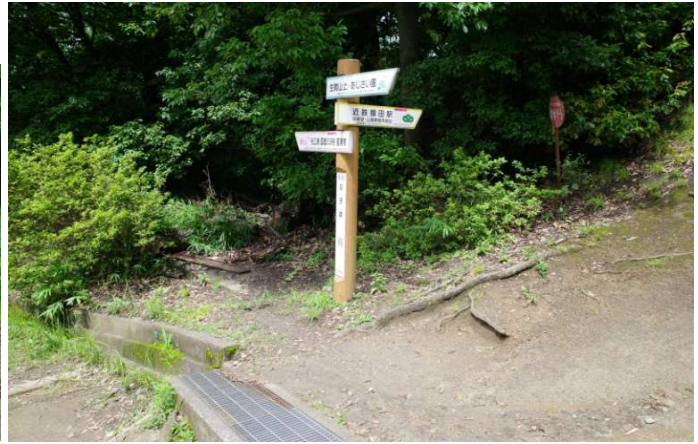
双子塚から左の細い道（写真右側） あじさい園への登山道