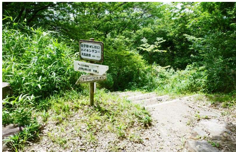
辻子谷南出合 ここから下山する