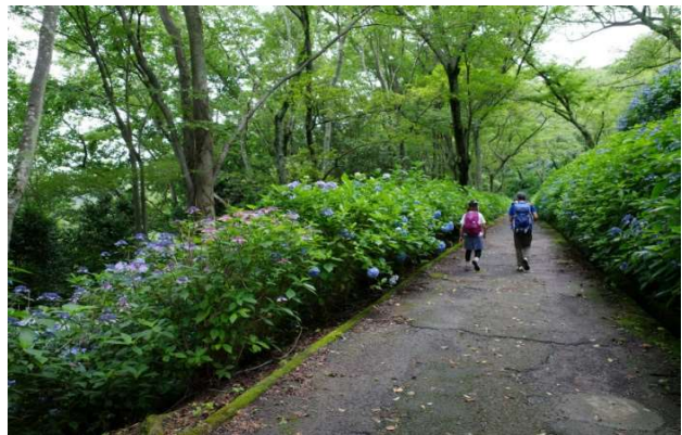
あじさい園の道（両側にあじさい）