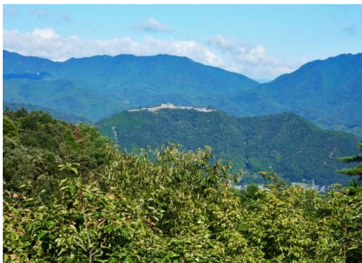
展望の丘より 竹田城址を望む