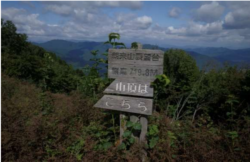
朝来山展望台より 北西方向を望む (蕪武岳・妙見山・西床尾山・東床尾山)