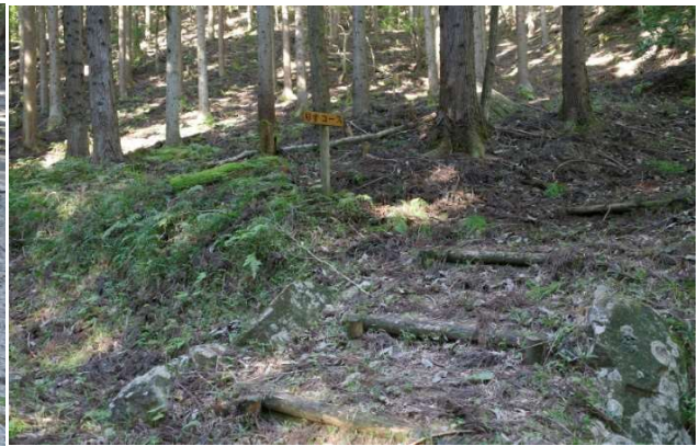
リスコースの入り口