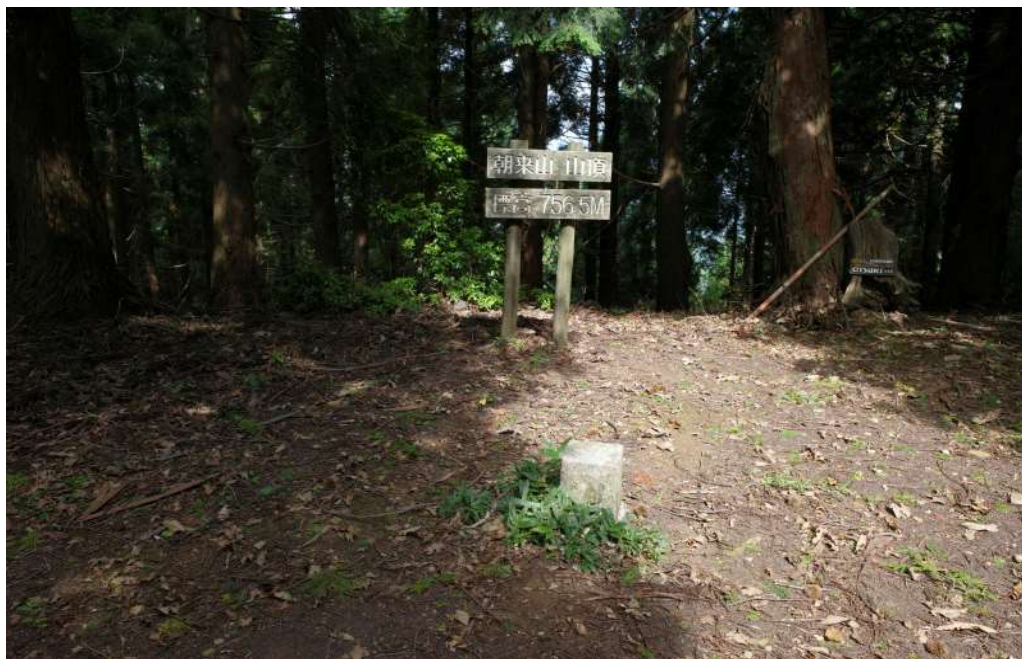
朝来山山頂と三等三角点 (展望はなし)