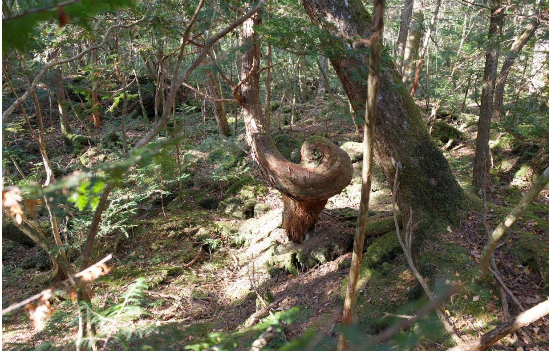
樹海に入ると変形した木が