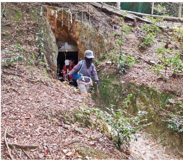
天岩戸くぐり(出口)