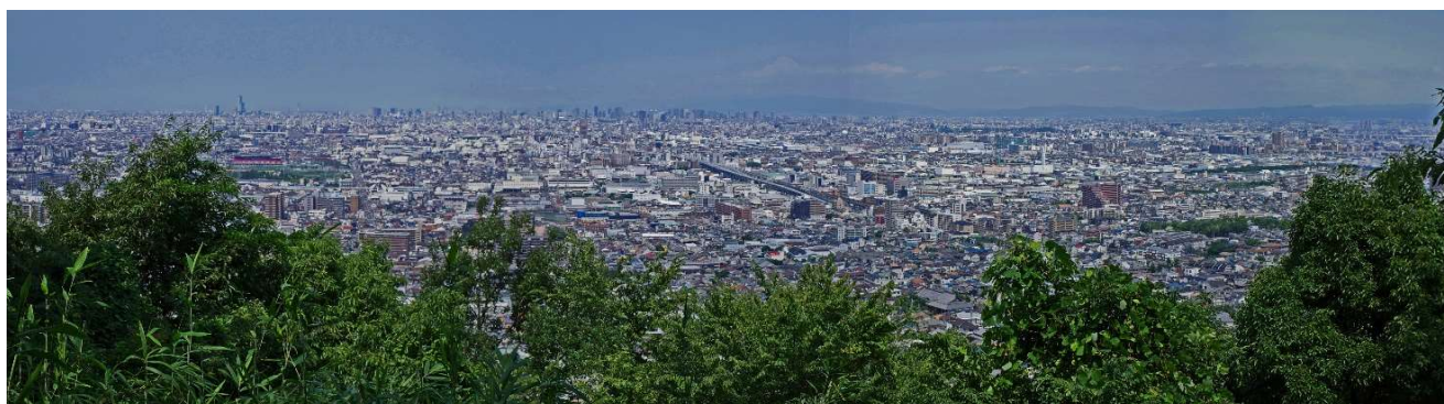
中展望所からの東大阪方面のパノラマ

私は登りは何とか遅くても歩けるが、下りは膝に負担が掛かり痛みが出てくるので皆さんとは途中で別れてケーブルで下ることに。